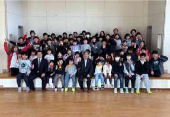
児童クラブきらりの集合写真

令和8年度の『児童クラブきらり開所式』が4月1日(水)子育て支援センターホールを会場に開催されました。 今年度は吉島小学校の新生6人全員が入所し、元気いっぱい初々しい笑顔あふれる開所式となりました。 児童クラブきらりでは、吉島小学校全校児童73人中58人が登録しています。また、6人の支援員が「遊び」「学び」「生活」を通して、児童の安全管理や学習支援を行いながら健全育成を図り、楽しく元気にのびのびと活動できるようにサポートしています。 小学校の長期休暇の際は、支援員が栄養や彩りを考えながら給食メニューを考え、温かいものを手作りで提供しています。児童たちは児童クラブの給食が大好きで、みんなで一緒に楽しく食べることで食育にも繋がっています。 OB・OGも遊びに来たり、スタッフとして手伝いに来て