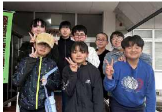
令和7年度卒業したみんな

令和7年度は8人の6年生が児童クラブを卒業しました。児童クラブの活動を通して得た学びやたくさんの思いをいつまでも忘れずに、新たな人との繋がりがりや経験を大切にしてほしいものです。 新たな中学生生活を精一杯楽しんで、また児童クラブに遊びに来てください。